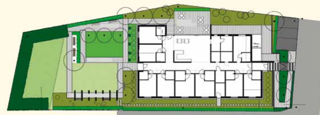
Aufsicht | Grundstück

Breipohls Hof ist eine Einrichtung der AWO Ostwestfalen-Lippe e.V.. Betrieben wird sie von der Zentrum für Pflege und Gesundheit gGmbH, einem Unternehmen der Klinikum Bielefeld GmbH und der AWO OWL. Die Baukosten wurden von der Stiftung Wohlfahrtspflege NRW, der Stiftung Deutsches Hilfswerk und der Wohnungsbauförderung des Landes NRW gefördert.