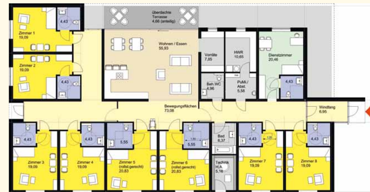
Grundriss | Haus